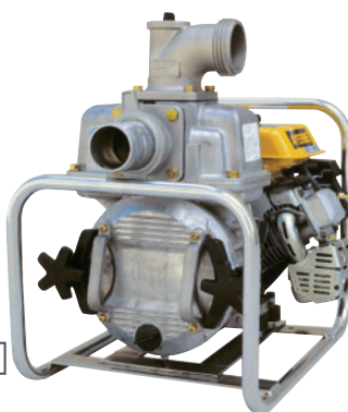
AY-H 50 P