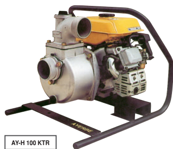
AY-H 100 KTR